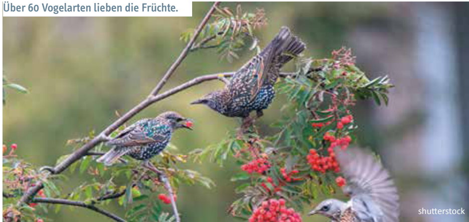
Über 60 Vogelarten lieben die Früchte.

tenbeständen. Durch ihre Beliebtheit beim Wild kann der Verbiss auf die Hauptbaumarten reduziert werden. Auch bei der Landschafts- und Waldrandgestaltung in Parks, Gärten oder an Straßen sowie im Vogelschutz wird immer mehr auf die Vogelbeere zurückgegriffen. Durch ihre große Windertragnis spielt die Eberesche eine besondere Rolle als Windschutzgehölz.